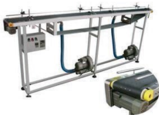
В вакуумной конвейерной упаковке