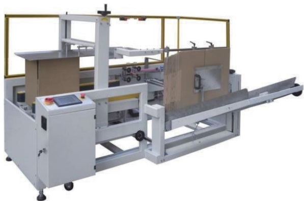
В линиях для производства картонной упаковки