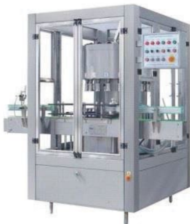
В разливочно-укупорочной вакуумной машине