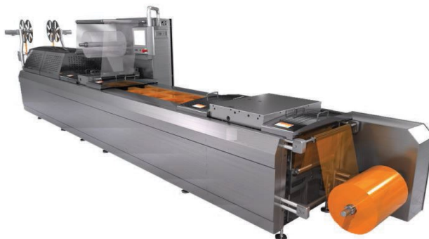
В вакуумных-формовочных станках