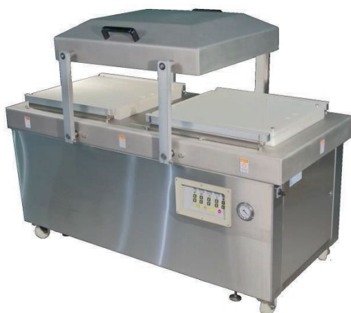
В напольных вакуумных упаковщиках